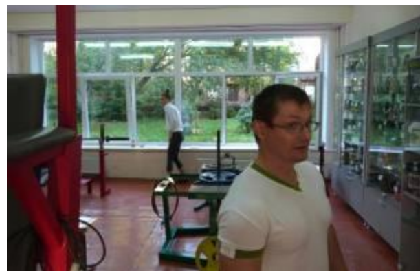
Проект «Представление фитнес - услуг», г. Ленинск-Кузнецкий Кемеровской области