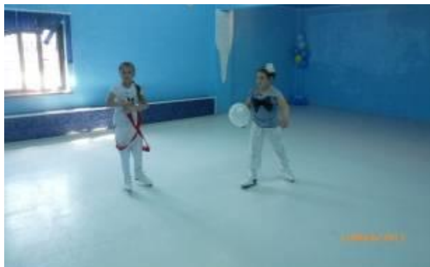
Проект «Открытие ледового зала «Спартак» (синтетический лед)», г. Ленинск-Кузнецкий Кемеровской области