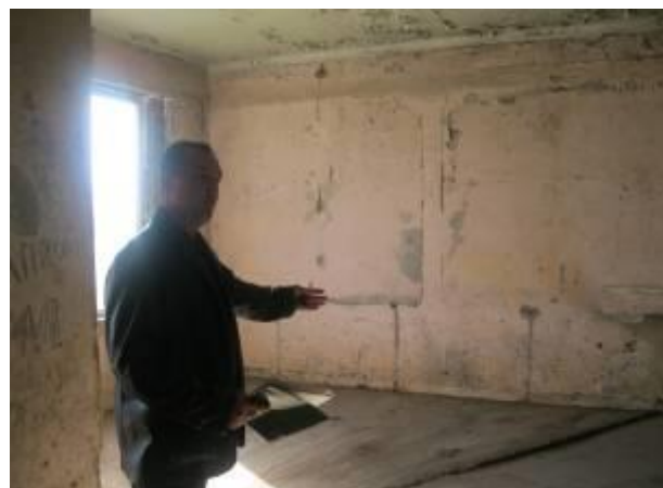
Проект «Создание многопрофильного швейного цеха», Алтайский район Республики Хакасия