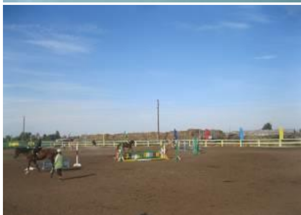
Проект «Иппотерапия для детей», Усть-Абаканский район Республики Хакасия