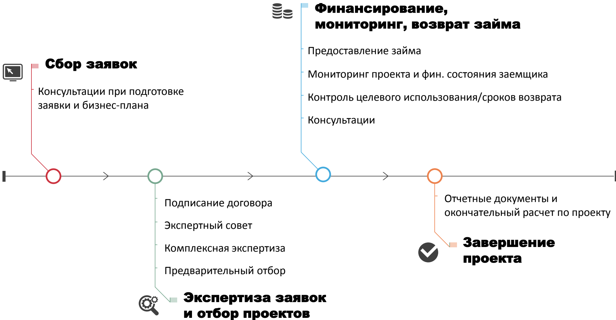
Схема работы с проектами