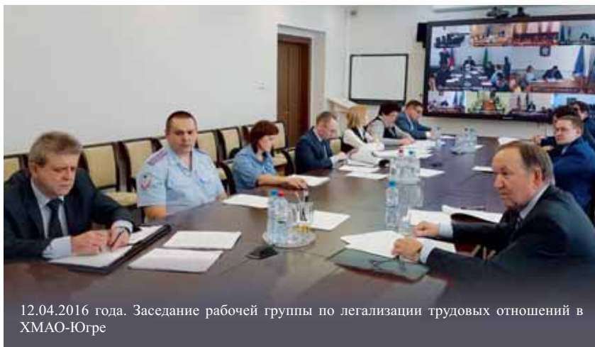
12.04.2016 года. Заседание рабочей группы по легализации трудовых отношений в ХМАО-Югре

■ Содействие повышению деловой квалификации и профессионализма хозяйственных руководителей и предпринимателей, их направлению на стажировки в зарубежные фирмы; проведению конференций, выставок, семинаров; принятие участия в создании учебных организаций, многофункциональных образовательных и научно-образовательных центров.