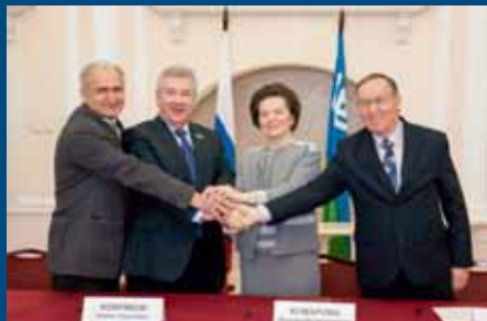
31.03.2016 года. Подписание Трёхстороннего соглашения о минимальной заработной плате в ХМАО-Югре