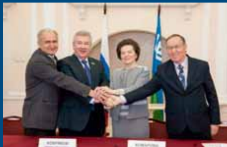
31.03.2016 года. Подписание Трёхстороннего соглашения о минимальной заработной плате в ХМАО-Югре