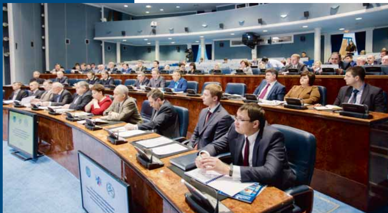
17.03.2016 года XIII Окружная конференция промышленников и предпринимателей ХМАО-Югры

■ Участие в деятельности примирительных комиссий, трудовом арбитраже по рассмотрению и разрешению коллективных трудовых споров.