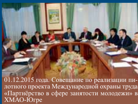
01.12.2015 года. Совещание по реализации пилотного проекта Международной охраны труда «Партнёрство в сфере занятости молодежи» в ХМАО-Югре