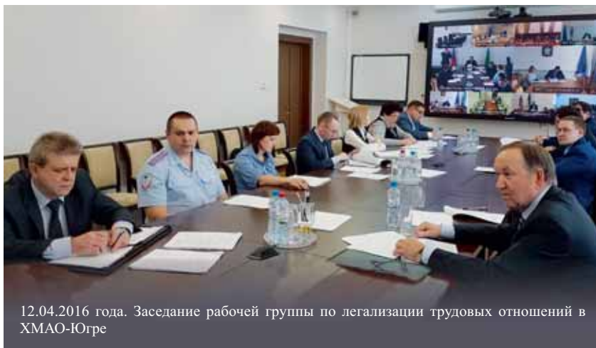
12.04.2016 года. Заседание рабочей группы по легализации трудовых отношений в ХМАО-Югре

■ Содействие повышению деловой квалификации и профессионализма хозяйственных руководителей и предпринимателей, их направлению на стажировки в зарубежные фирмы; проведению конференций, выставок, семинаров; принятие участия в создании учебных организаций, многофункциональных образовательных и научно-образовательных центров.