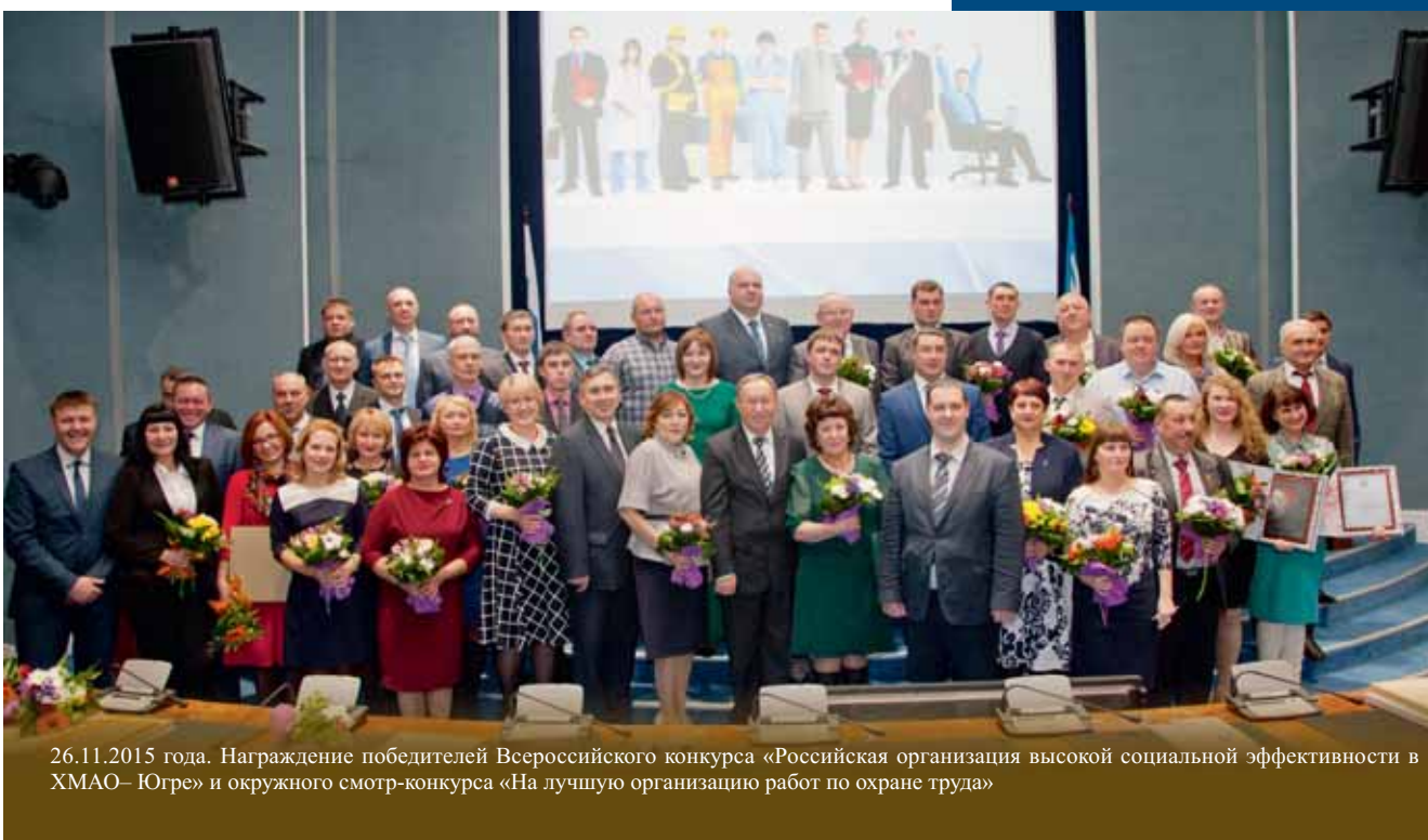
26.11.2015 года. Награждение победителей Всероссийского конкурса «Российская организация высокой социальной эффективности в ХМАО– Югре» и окружного смотр-конкурса «На лучшую организацию работ по охране труда»

■ Выдвижение руководителей, работников и коллективов предприятий, предпринимателей на соискание почетных званий, премий, государственных наград и других видов поощрения.